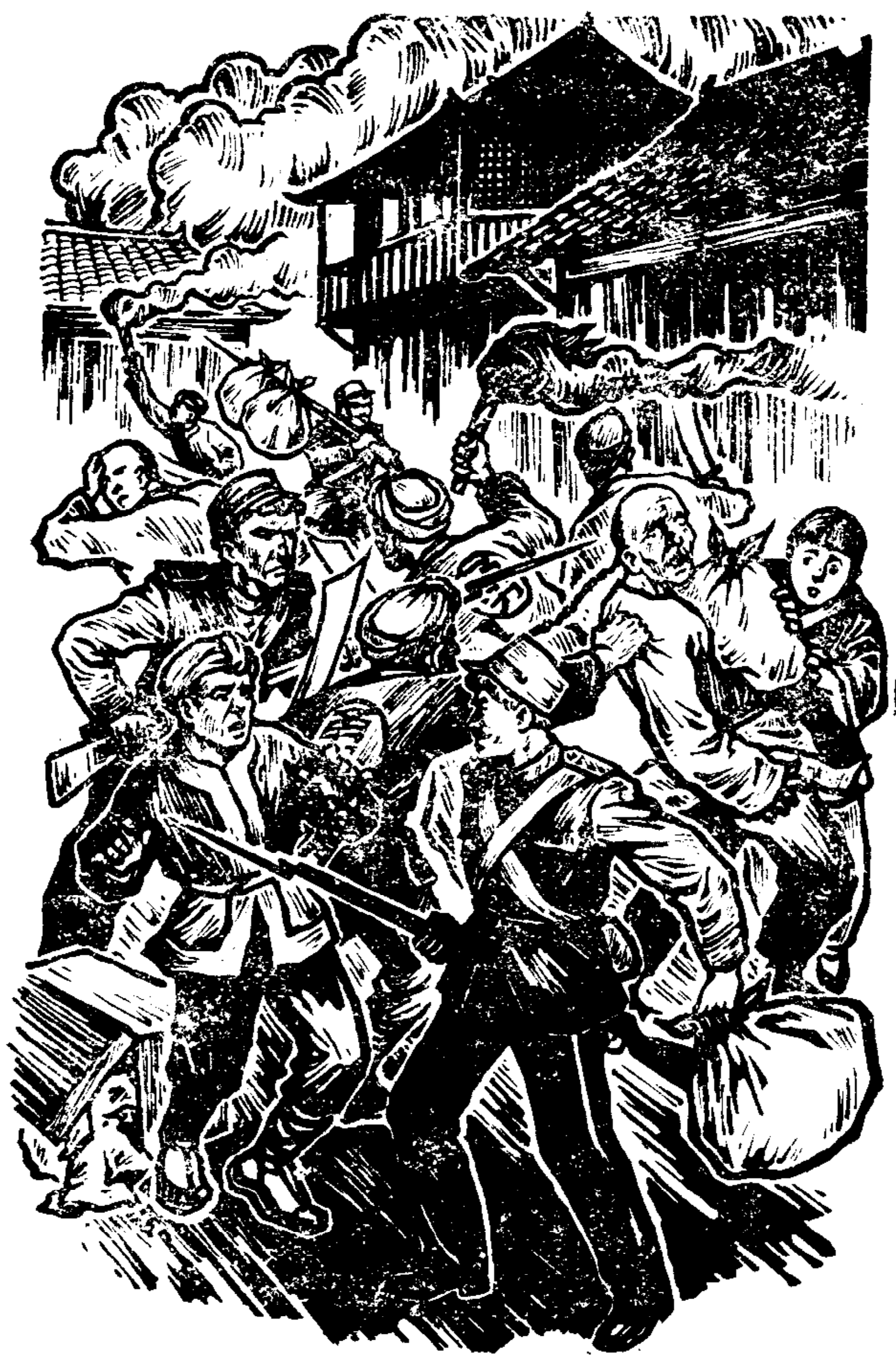
中外反革命军队烧、杀、抢、掠，无恶不作