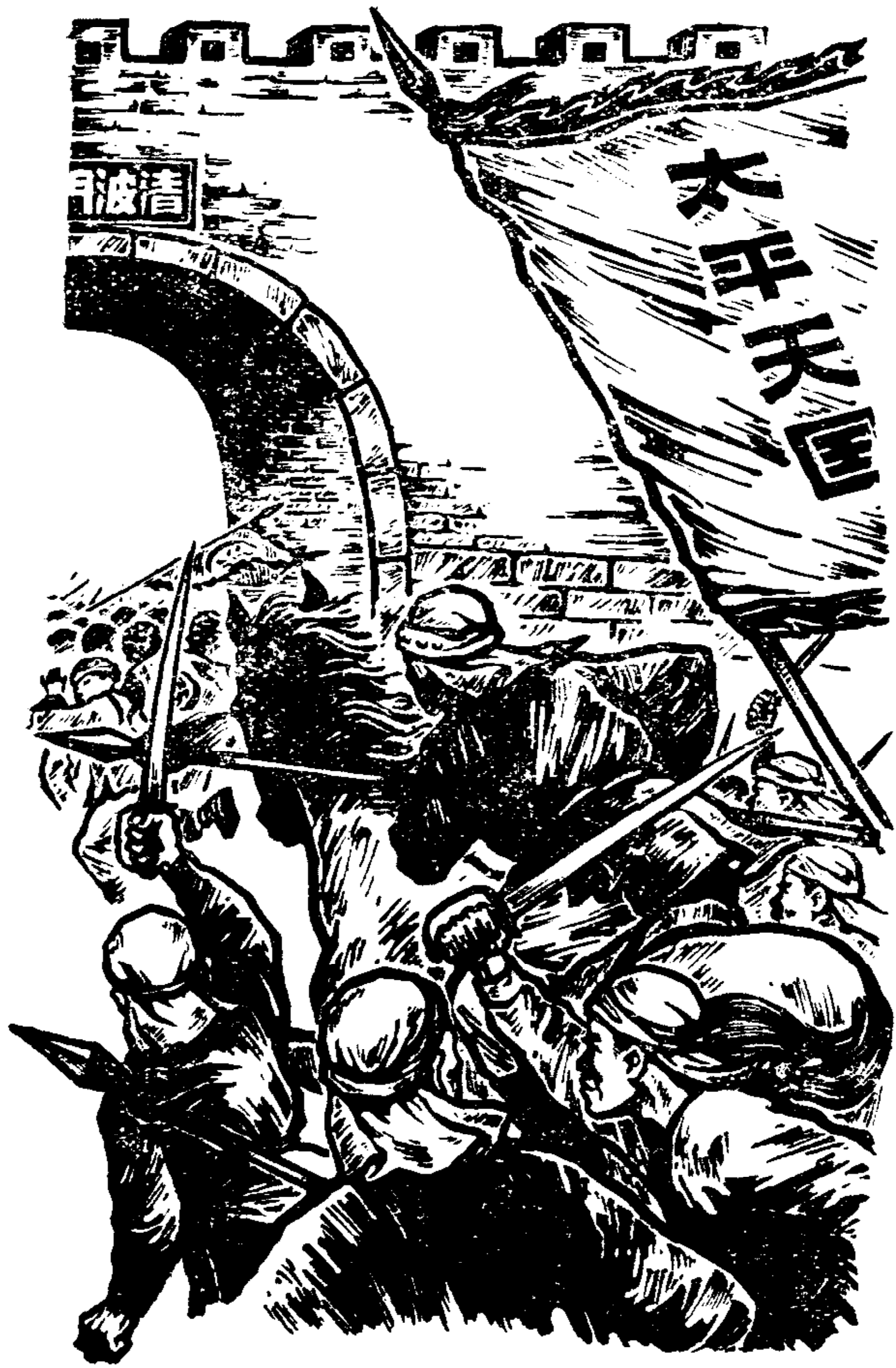
李秀成巧計攻杭州